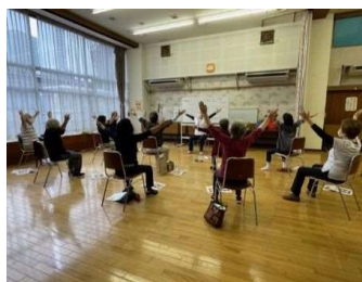
「ますます元気教室」の様子

※イベントや講座等の実施にあたっては、ソーシャルディスタンスの確保や手指消毒の実施などにより、新型コロナウイルス感染症対策を講じます。