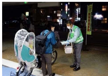
自転車ツーロック（二重施錠）啓発活動の様子